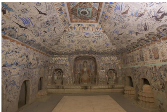
莫高窟第 285 窟，西魏

科技在文物保育方面所扮演的角色越來越重要，敦煌研究院在數碼影像紀錄、三維信息提取、虛擬現實重現，以至透過互聯網和多媒體節目作推廣方面，都是內地博物館界的先驅，而且取得了顯著成績。是次展覽有超過 100 組展品，透過西魏時期極具代表性的 285 窟、以數碼技術展現的虛擬洞窟和莫高窟第 61 窟「五臺山圖」壁畫、文物文獻、多媒體互動裝置及影音節目等，全方位介紹敦煌的歷史和藝術內容。