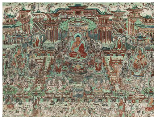
觀無量壽經變，莫高窟第 217 窟，盛唐